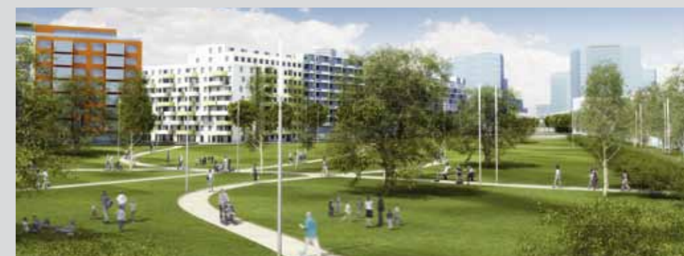
Wohnungen und Park im Sonnwendviertel