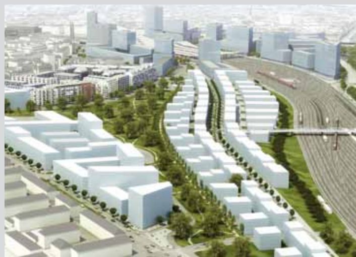
Blick auf das Sonnwendviertel