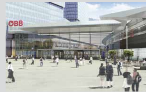
Vorplatz Nord am Südtiroler Platz

Mit dem Quartier Belvedere wird der Hauptbahnhof auch zur neuen Geschäftsadresse Wiens. Ob die Zentrale der Erste Bank, Hotels oder moderne Büroflächen: In unmittelbarer Nähe zum Schloss Belvedere oder zum 20er Haus gelegen, nutzt das neue Geschäftsviertel die Vorzüge der guten Lage.